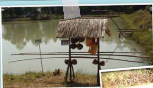
อบต.หินลาด อ.บ้านกรวด จ.บุรีรัมย์