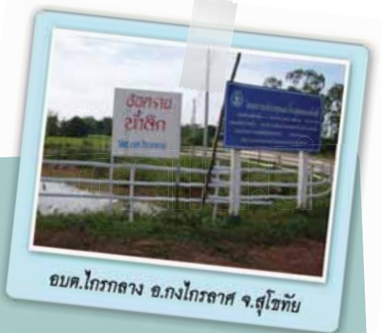
อบต.โกรกกลาง อ.โกรกธาศ จ.สุโขทัย